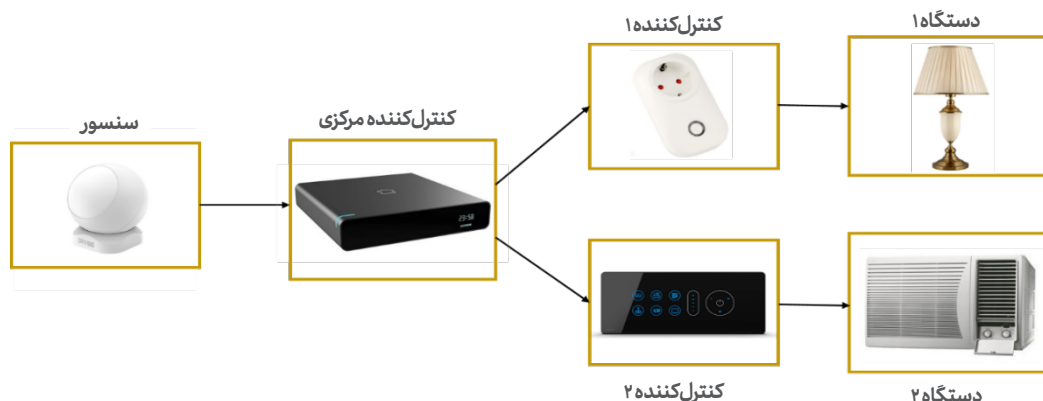
تصویر ۱- معماری سیستم اتوماسیون خانگی (Mehrabi et al., 2014).

اینترنت اشیاء مفهومی است که اتصالات بین اشیاء زندگی روزمره را با استفاده از انواع مختلف سنسورها مانند شناسایی فرکانس رادیویی ۶ برقرار می‌سازد. این سنسورها، محرک‌هایی هستند که برای حس کردن، جمع‌آوری و انتقال اطلاعات مهم از محیط اطراف خود به اینترنت مورد استفاده قرار می‌گیرند. اینترنت اشیاء در چند سال گذشته یکی از موضوعات داغ در حوزه‌ی فناوری بوده و انتظار می‌رود که در جهان، انقلابی مشابه انقلابی که اینترنت به‌وجود آورد، ایجاد کند (میگلی نژاد و سرمدی، ۱۳۹۶، ۱). مکانیسم اینترنت اشیاء شامل چندین عنصر مانند شناسایی، سنجش، ارتباط، محاسبات، خدمات و معنانشناسی است که شناسایی مهم‌ترین آن است، زیرا تضمین می‌کند که اطلاعات و خدمات مورد نیاز به آدرس صحیح برسد. محاسبات با جمع‌آوری اطلاعات از منابع مختلف همراه شده و به مراکز داده ارسال می‌شود. سپس داده‌ها با استفاده از شرایط و عوامل مختلف برای اهداف مختلف سرویس‌ها، مورد تحلیل قرار می‌گیرند. سنسورها می‌توانند برای جمع‌آوری رطوبت، درجه حرارت و... استفاده شوند. ارتباطات معمولاً با استفاده از خانواده‌ی پروتکل‌های شبکه بی‌سیم ۷ ، بلوتوث و... انجام می‌شود (میگلی نژاد و سرمدی، ۱۳۹۶، ۲). در بحث هوشمندسازی ساختمان‌های مسکونی از اینترنت اشیاء برای تشکیل یک سیستم مدیریت جامع ساختمان استفاده می‌شود. سیستم مدیریت جامع ساختمان ۸ به سیستمی گفته می‌شود که توسط آن بتوان اجزای مورد نیاز یک ساختمان را کنترل و مدیریت کرد. خانه‌ی هوشمند یک سیستم مدیریت ساختمان کوچک است و در آن نیازی به ایجاد شبکه بین سیستم‌های مختلف نیست بلکه در اکثر مواقع تنها یک سیستم مورد نیاز است و کافی است تمام سنسورها و مصرف‌کننده‌ها به‌طور مستقیم به سیستم متصل شوند (مشعل‌چی، ۱۳۹۵، ۲).