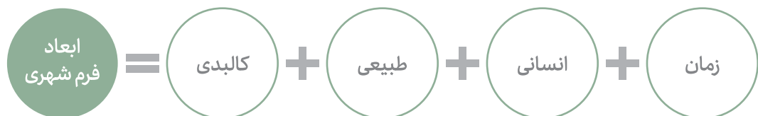
تصویر ۱- ابعاد فرم شهری