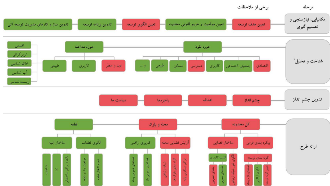
تصویر ۵- بررسی میزان انطباق مراحل انجام شده در فرآیند تهیه‌ی طرح آماده‌سازی شهر جدید هشتگرد با مدل مفهومی پیشنهادی پژوهش حاضر

در نهایت به‌منظور نمایش دقیق میزان تطابق فرآیند تهیه‌ی طرح آماده‌سازی شهر جدید هشتگرد با فرآیند پیشنهادی پژوهش حاضر (مبتنی بر کاربست کدهای فرم‌منا در تهیه‌ی این طرح‌ها)، مدل نهایی ارزیابی طرح شهر جدید هشتگرد نسبت به فرآیند پیشنهادی پژوهش حاضر، در تصویر ۵ آورده شده است. در این تصویر، مراحل که در طرح آماده‌سازی شهر جدید هشتگرد نیز انجام شده به رنگ سبز و باقی مراحل (که در طرح مورد مطالعه، به آن‌ها پرداخته نشده است)، به رنگ قرمز نشان داده شده‌اند.