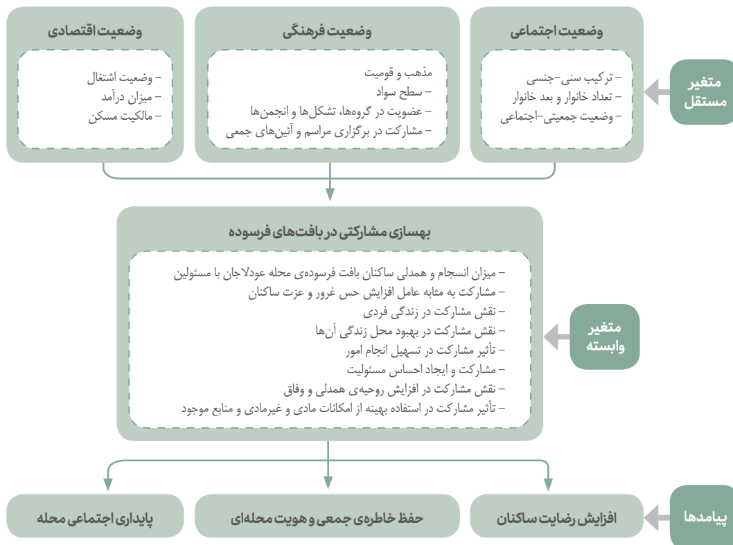
تصویر ۱- مدل مفهومی پژوهش