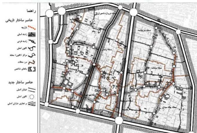
تصویر ۲- نقشه‌ی محله‌ی عودلاجان (مهندسین مشاور نگین شهر، ۱۳۸۴ و مهندسین مشاور باوند، ۱۳۸۹)

طرح‌های متعددی برای این محله‌ی تاریخی تهیه شده که از آن میان، می‌توان به طرح بهسازی محله‌ی عودلاجان، طرح ساماندهی، بهسازی و نوسازی محله‌ی عودلاجان (مهندسین مشاور نگین شهر، ۱۳۸۴)، طرح نوسازی بخش میانی محله‌ی عودلاجان (سازمان نوسازی شهر تهران، ۱۳۸۶)، طرح ساماندهی بخش میانی محله‌ی عودلاجان (مهندسین مشاور کهندژ، ۱۳۸۸) و طرح منظر شهری محله‌ی تاریخی عودلاجان (مهندسین مشاور باوند، ۱۳۸۹) اشاره کرد؛ اما تا کنون هیچ‌یک از این طرح‌ها اجرا نشده و محله همچنان روند فرسودگی خود را در تمام ابعاد کالبدی، اجتماعی، اقتصادی و زیست‌محیطی ادامه می‌دهد. بر اساس مشاهدات صورت گرفته، تخریب روزافزون بافت محله و بناهای قدیمی، تبدیل شدن بناهای مسکونی به کارگاه و انبار، افزایش تعداد معتادان و ناامنی در محله مشاهده می‌شود. از اقدامات و تلاش‌های جدی و مستمر که در مهر و موم‌های اخیر به‌منظور حفظ و باززنده‌سازی محله صورت گرفته، می‌توان به مرمت بخشی از بازارچه‌ی عودلاجان اشاره نمود.