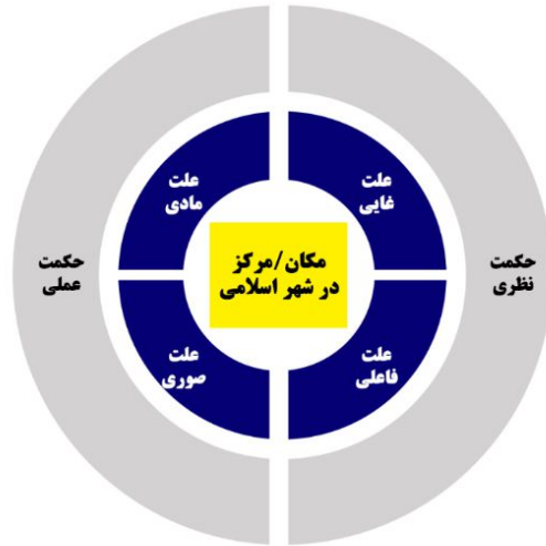
تصویر ۳- مدل ارتباطی جایگاه حکمت عملی و نظری در مفهوم مرکز در شهر ایرانی-اسلامی